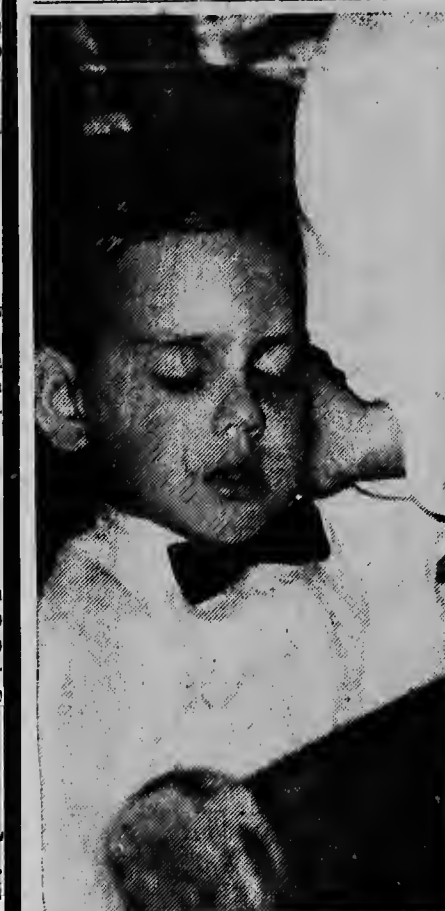
E mucha homber chiquito aqui a fada masha lihe di tur e mucha muhanan bunita durante e show di moda di diadomingo anochi. „Duna e parti di mi unia na Fikkie”, el a bisa y a bai na terra di ensenjo.

SANTIAGO DE CHILE — Ayera 5 persona a muri a consecuencia di incidentenan cu a tuma lugar despues cu e federacion cu simpatia pa comunismo a proclama un huelga di 24 ora. E huelga tabata pa protesta contra e gastonan di bida cu a subi. Parce su mayoria di e obreronan no a sigui e yamada pa huelga. Mas o menos cuarenta persona a resulta herida. Entre e victimanan tin tantu polis como civilian.